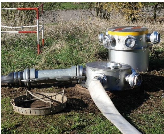
Abb. 2: Keine Unfallgefahr