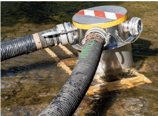
Abb. 4: Als Zubehör Einlaufgitter und Abstandshalter zum Boden

Dabei entstand auch die Idee, die SET zur Förderung von sauberem Brauchwasser aus Gewässern einzusetzen. Einen oder mehrere Saugschläuche an die umgedrehte SET angeschlossen und ins Gewässer geschoben, ermöglicht einen Wassereinlauf in ca. 60 cm Höhe über Grund, was Schlamm und Sedimente fernhält. Zudem erreicht man damit eine „zentrale Entnahmestelle“ mit geringerem Einsatzaufwand.