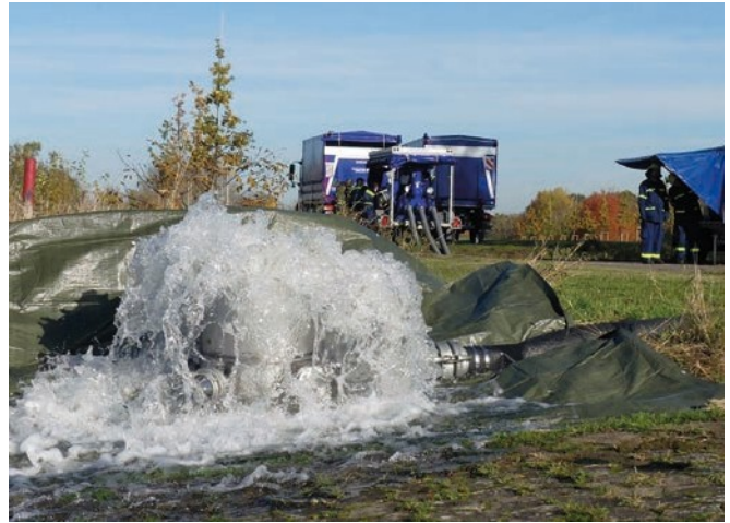
Abb. 3: Die Auslauftonne im Einsatz

Ein weiterer Vorteil bei der Verwendung der SET als Auslauftonne ist der Wegfall von Sicherungsmaßnahmen für die Druckschläuche (Abbildung 3).