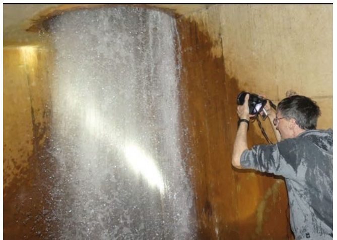
Abb. 5: Hier ist gut zu erkennen, wie das Wasser drucklos aus

dem Schacht in den Kanal fällt, nachdem die Wasserstrahlenergie in der SET aufgehoben worden ist.